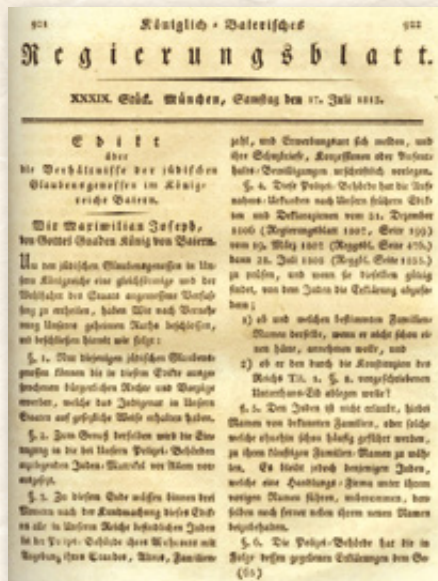
▲ Fortschritt oder Rückschritt? Das 1813 in Bayern erlassene Judenedikt gewährte der jüdischen Bevölkerung einerseits Religionsfreiheit. Andererseits wurde in ihm bestimmt, dass in jeder Gemeinde Bayerns nur eine bestimmte Anzahl von Jüdinnen und Juden leben durfte, was nicht wenige zur Auswanderung zwang.