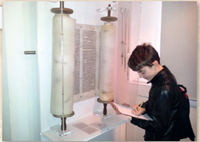
▲ Ein Schüler der Mittelschule Waldsassen untersucht im Jüdischen Museum Franken eine Torarolle. Macht auch ihr euch auf die Suche nach den Spuren jüdischen Lebens.