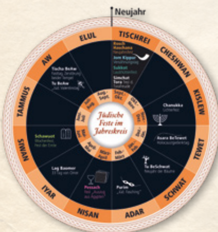
▲ Jom Kippur, das übersetzt „Tag der Versöhnung“ bedeutet und als höchster jüdischer Feiertag gilt, das als „jüdischer Fasching“ bezeichnete Purimfest oder Schwuot, das jüdische Erntedankfest – jüdische Feier- und Festtage sind über den ganzen Jahreskreis verteilt. Findet heraus, wie Jüdinnen und Juden früher diese Feierlichkeiten in Bayern begangen haben und wie sie es heute tun.