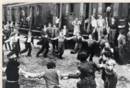
▲ Am 13. Juli 1948 verließ ein Zug die bayerische Landeshauptstadt München, um 600 jüdische Holocaust-Überlebende über Marseille in den neu gegründeten Staat Israel zu bringen – für die Auswanderer ein Grund zum Feiern. Andere Jüdinnen und Juden entschieden sich dagegen zum Bleiben und halfen, die heute insgesamt wieder 15 jüdischen Gemeinden in Bayern neu aufzubauen.