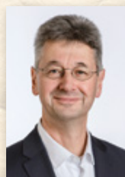
Prof. Dr. Michael Piazolo Bayerischer Staatsminister für Unterricht und Kultus