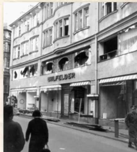
▲ Eines der dunkelsten Kapitel deutscher und bayerischer Geschichte sind die Pogrome in der Nacht vom 9. auf den 10. November 1938. Von den Nationalsozialisten wurden damals jüdische Synagogen, Wohnungen sowie Geschäfte wie das abgebildete Kaufhaus Uhlfelder zerstört und Jüdinnen und Juden angegriffen, verletzt oder gar ermordet.