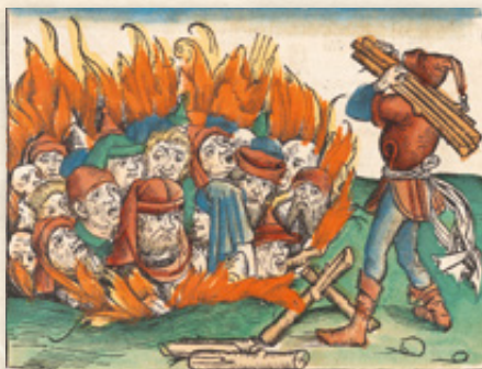
▲ Das „Rintfleisch-Pogrom“, benannt nach dem Anführer gewalttätiger Horden, die Tausende Jüdinnen und Juden im Jahr 1298 vor allem in Franken, aber auch in der Oberpfalz und Teilen Altbayerns gezielt aufspürten, verfolgten und ermordeten, war der Ausgangspunkt für viele folgende gewalttätige Ausschreitungen gegen die jüdische Bevölkerung, die sich haltlosen Vorwürfen und Vorurteilen ausgesetzt sah.

Seuchen wie die Pest zu finden, waren jüdische Gläubige als eine Minderheit leichte Opfer. Die systematische Entrechtung, Verfolgung und Ermordung der Jüdinnen und Juden Europas durch das menschenverachtende NS-Regime bildete auch in Bayern den traurigen Tiefpunkt des Umgangs mit der jüdischen Bevölkerung.