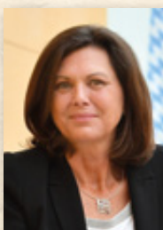
Ilse Aigner Präsidentin des Bayerischen Landtags